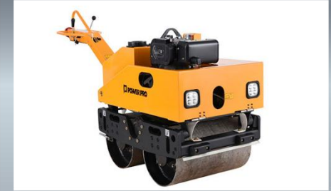
Rodillo Compactador Manual Motor: 406 c.c Fuerza Impacto: 2.000 kg