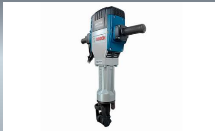
Martillo Demoledor Motor: 2.000W