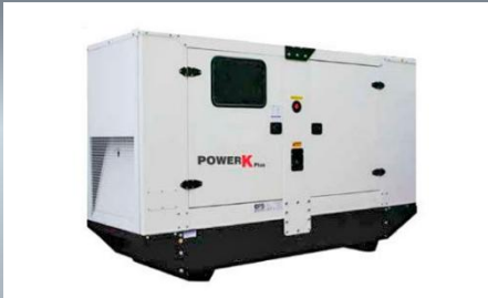
Generador Eléctrico Potencia: 80 kW/ 100 KVA