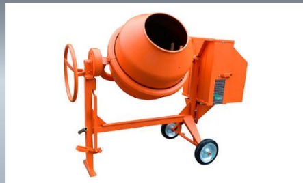
Betonera Volteo Lateral Motor: 6.5 hp Capacidad de Mezcla: 130 Lts.