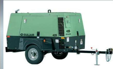
Compresor de Aire