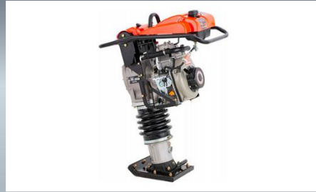
Vibropison Motor: 4 Tiempos Potencia: 4.8 HP Peso Operacional: 96 kg