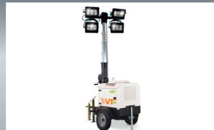
Torre de Iluminación Potencia: 4 luces Led de 320W